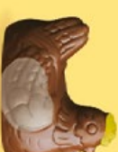
Duo praliné et ganache caramel