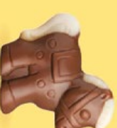
Praliné croustillant aux éclats de crêpe dentelle