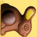
Praliné et riz soufflé