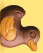
Praliné avec sucre pétillant