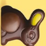
Praliné et éclats d'amandes caramélisées